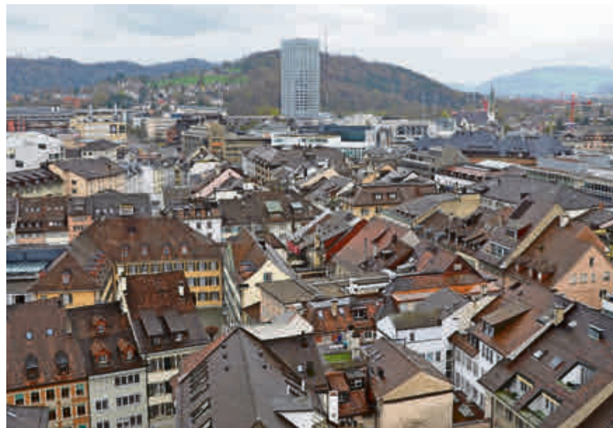
In der Stadt Winterthur sollen Radikalisierungen verhindert werden.

Seit rund anderthalb Jahren beschäftigt sich der Stadtrat nun mit dem Phänomen der Jihad-Reisenden. Die Zuständigkeiten sind dabei klar geregelt. Im Bereich Sicherheit liegt die Hauptverantwortung beim Kanton und beim Bund; die Stadtpolizei leistet Unterstützung. Der Stadtrat selbst kann insbesondere bei der Prävention Massnahmen ergreifen. Deswegen wurde nun beschlossen, eine Fachstelle für Extremismus und Gewaltprävention zu schaffen. Sie wird für die Bevölkerung